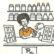
a la farmacia